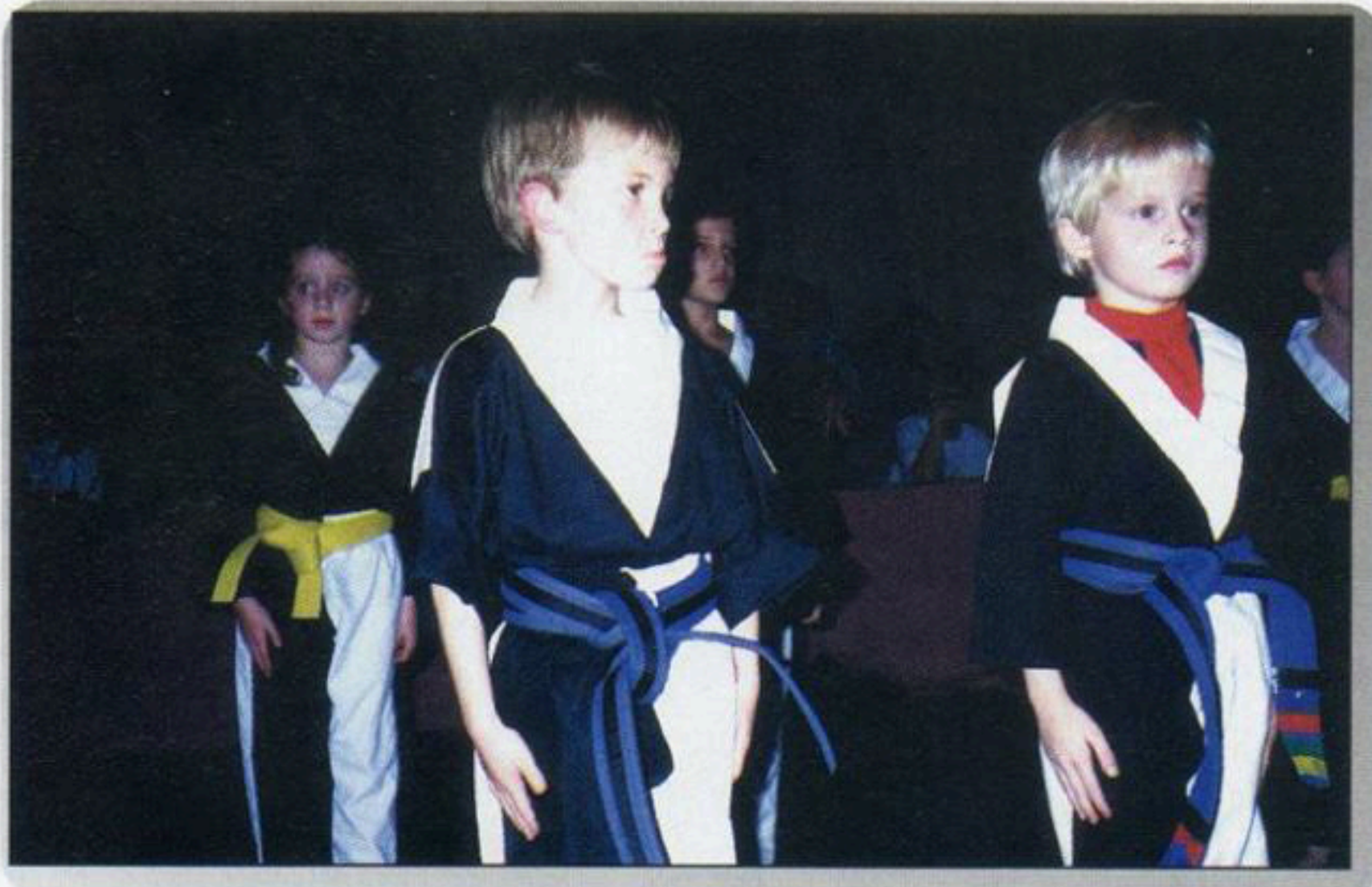
Tým pěti- až šestiletých dětí při týmové sestavě

Tak skončil první šampionát, druhý, ještě prestižnější a významnější, náš team dosud čekal, a to v New Yorku "EMPIRE STATE NATIONALS". Datum jeho konání byl 8 - 9. listopadu.