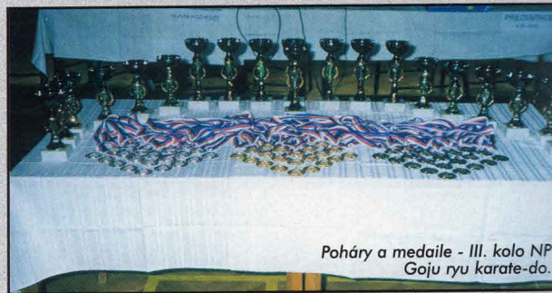
Poháry a medaile - III. kolo NP Goju ryu karate-do.

Oba dva se dostali těsně k sobě na takovou vzdálenost, že jeden z nich musel udělat takovou techniku, aby se vyprostil z klinče. Soupeř chytil Puzrlu za límec (Ryukatatori - Aikido), ale ten na nic nečekal a provedl přehoz (Koshi nage - Aikido) - prostě ho chytil a pře-