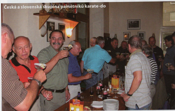
Česká a slovenská skupina pamětníků karate-do